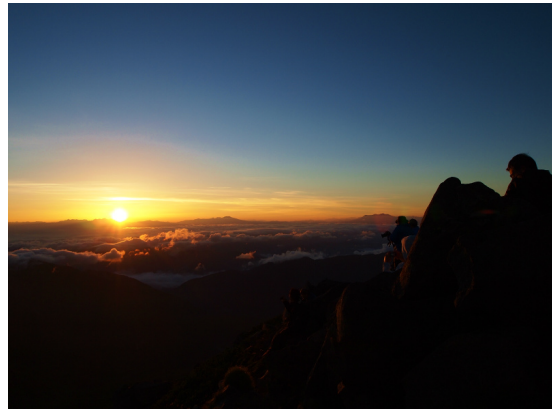
石川県白山2700mからの日の出