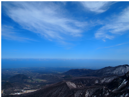
鳥取県大山から日本海を望む

私もともと山ってスキーを付けて滑り降りるものと思っております、登るなんて「もってのほか」と拒絶していたんですが、行き付けの歯医者さんで山のDVDが流れてたんですよ。イタイ歯を治療されて弱気になっている時に映し出される山々を見てみると、そこに行けば何かがあるような気持ちになって登り始めたのがキッカケなんです。