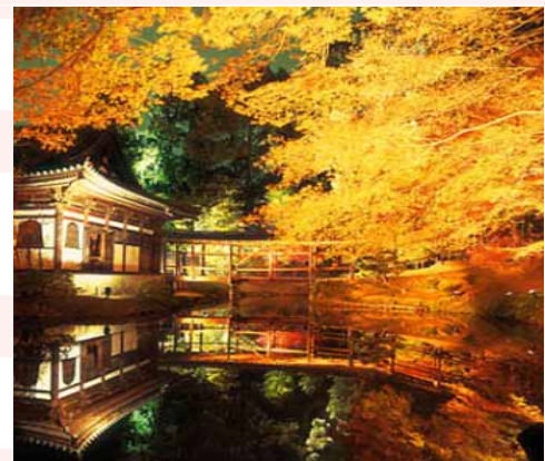
高台寺「臥龍池(がりゅうち)」に映る紅葉