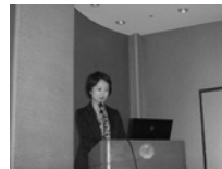
バックオフィス 清水