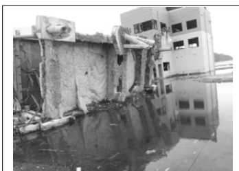
津波で鉄筋コンクリートのビルが杭を引き抜いて倒れていた。

そこには通販やインターネットには到底できない「プロ代理店の誇り」を見た気がします。