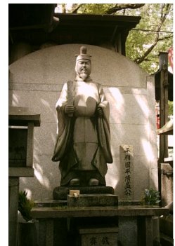
若一神社 平清盛公像